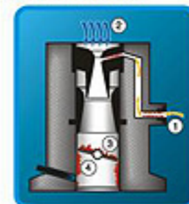
Des.2. Carburator (1) – carburant; (2) – aer; (3) – clapeta carburatorului; (4) – depuneri