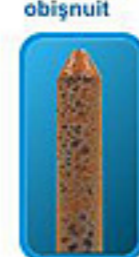
Des.4. Protecția împotriva coroziunii (tija pentru încercări)