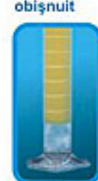
Des. 5. Protecție împotriva formării emulsiei