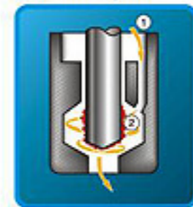
Des. 3. Elementul injectorului (1) – carburant; (2) – depuneri